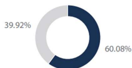
Top 10 Holdings as % of Total

Top 10 holdings as a percentage of Total Net Assets. Portfolio Holdings are subject to change at any time. References to specific bonds should not be construed as a recommendation to buy or sell and should not be assumed profitable.